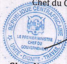
Simplicie Mathieu SARANDJI

Le Premier Ministre, Chef du Gouvernement