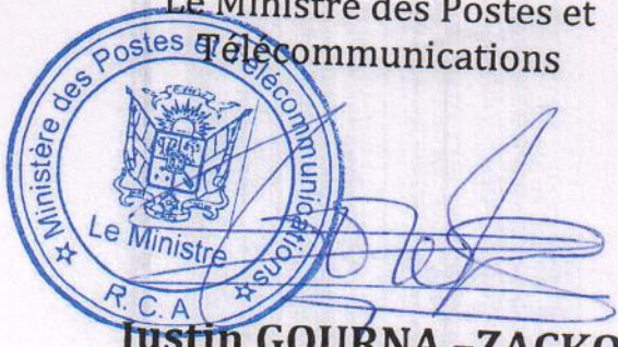
Justin GOURNA -ZACKO

Le Ministre des Postes et Télécommunications