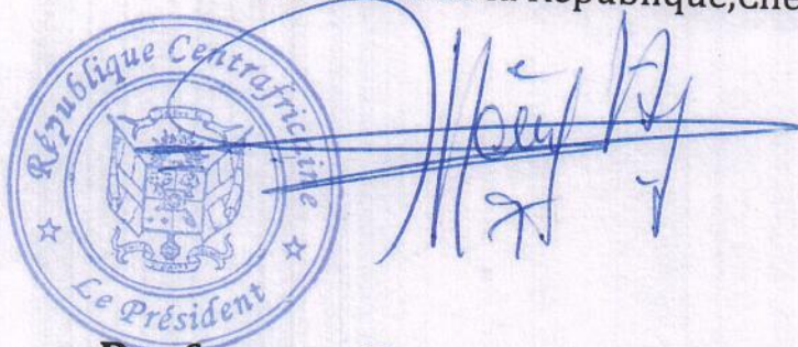
Professeur Faustin Archange TOUADERA.

Le Président de la République, Chef de l'Etat